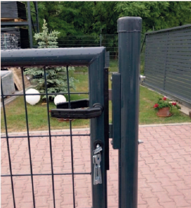
Zamek na klucz.